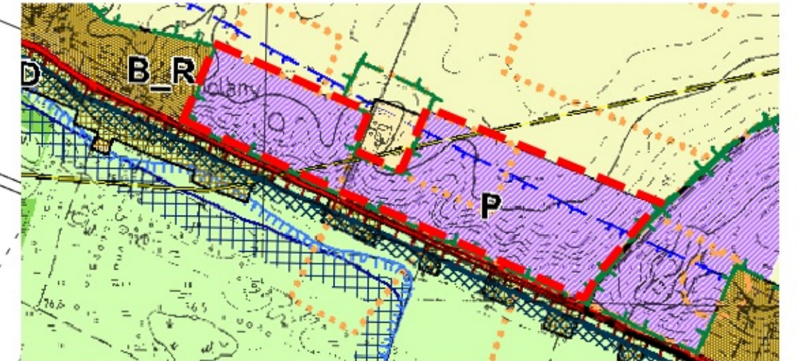
GRANICA OBSZARU OBJĘTEGO PLANEM MIEJSCOWYM