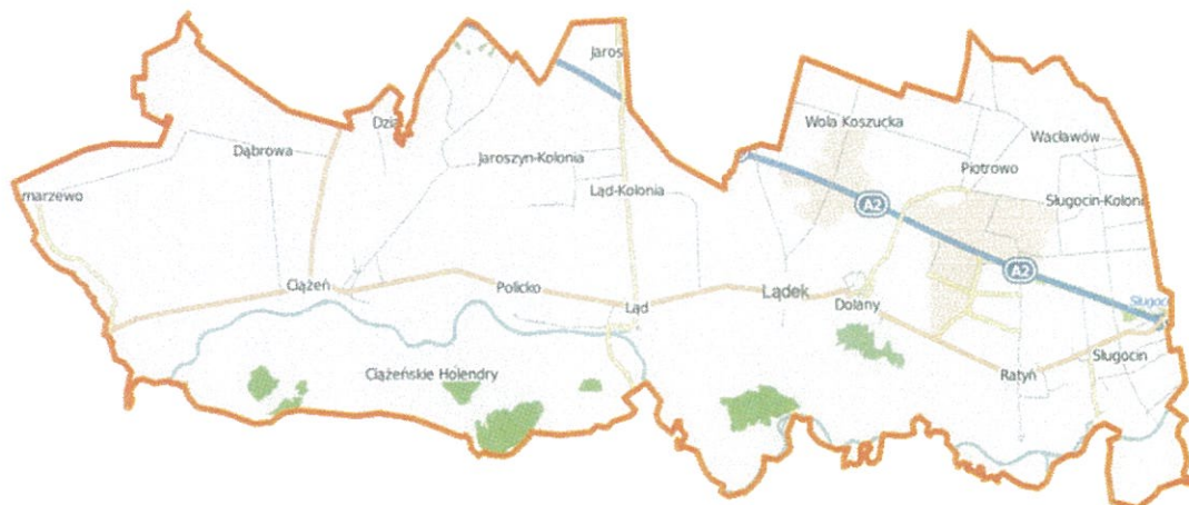
RYS. 1 Gmina Łądek